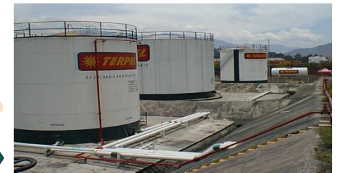
Plantas de Abasto