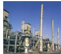
Planta de producción