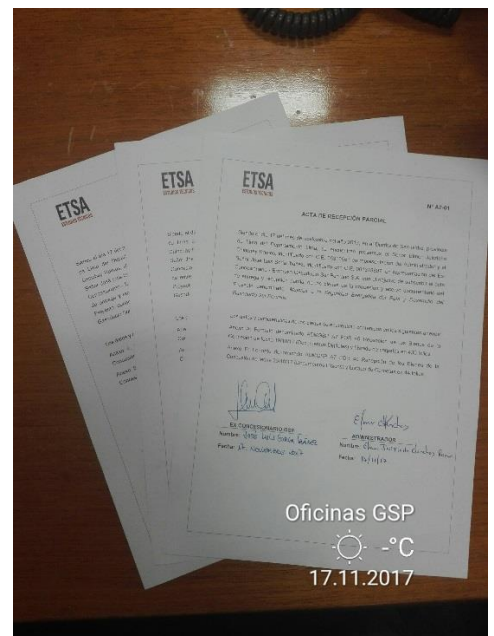
Acta de recepción Parcial del acervo documentario, por triplicado.