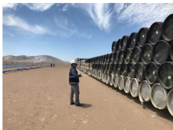
La Joya – Inventario de tuberías de 32" de diámetro