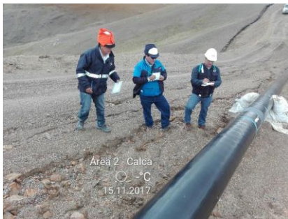
KP 6+136 del Gasoducto Secundario Anta-Cusco. Verificación de lingada (conjunto de tubos unidos por cordones de soldadura).