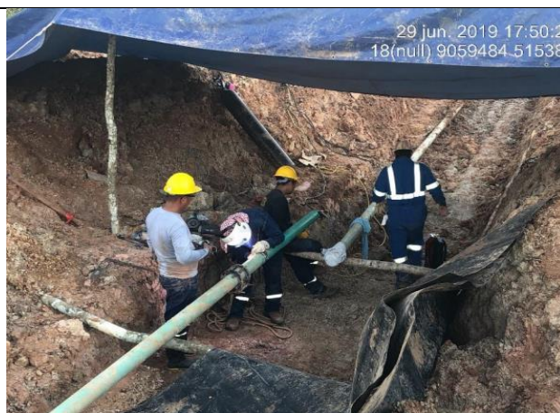
Figura 14: Vista de la alineación de uno de los extremos del ducto con el niple antes de iniciar con la soldadura.