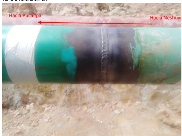
Figura 16: Vista del cordón de soldadura en la junta del niple que reemplazo el tramo afectado.