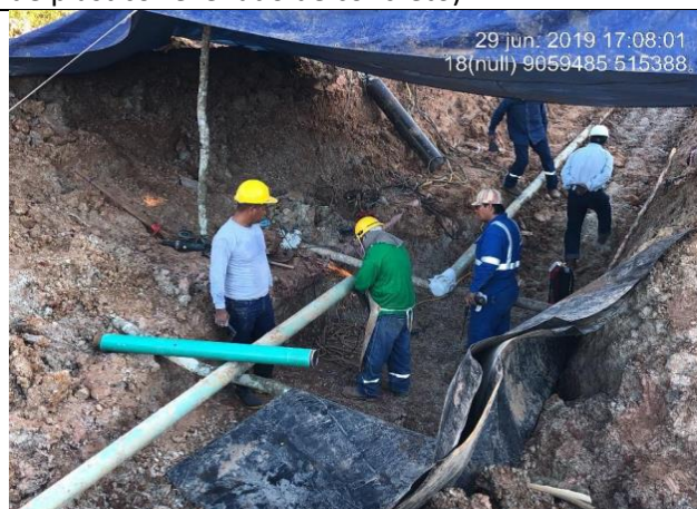
Figura 13: Vista de la preparación de la superficie, con amoladora, de los extremos de la tubería.