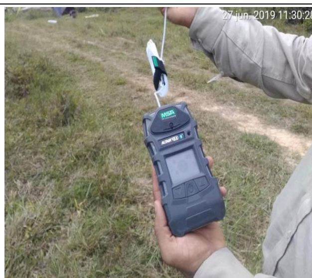
Figura 08: Vista de la medición de nivel de explosividad en la zona de la falla.