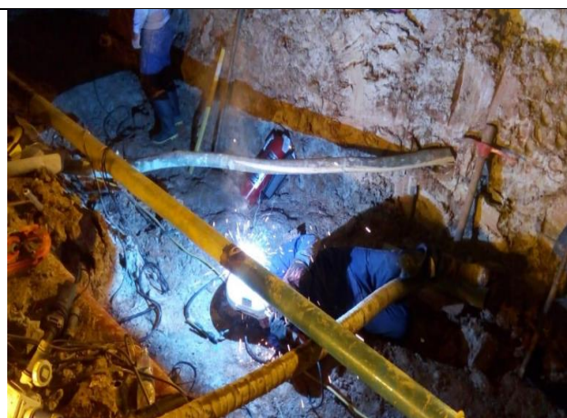
Figura 15: Vista de las actividades de soldadura.