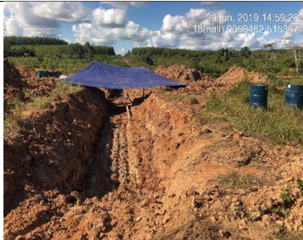
Figura 12: Vista del área techada para los trabajos de soldadura.