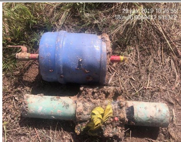
Figura 11: Vista de los accesorios artesanales (grampa, llaves de paso y tubo en medio del bidón de plástico relleno de concreto).