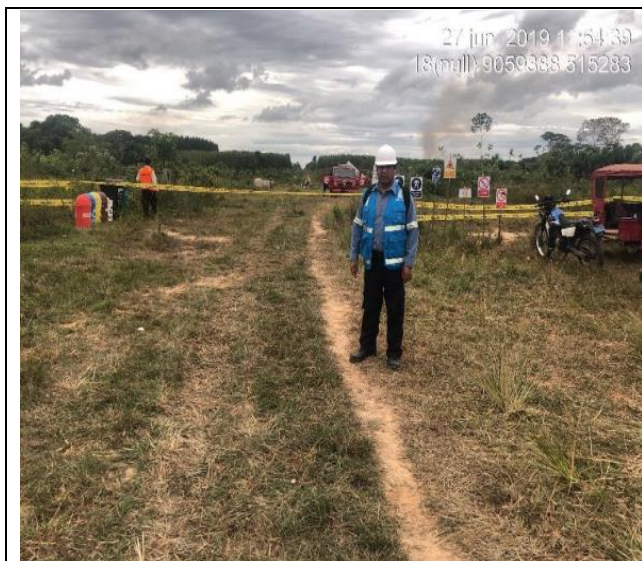
Figura 07: Presencia del supervisor de Osinerghmin y vista del acordonamiento de la zona de la falla (KP 58+500 del ducto de 4" de GN del tramo Estación Neshuya - Planta de Fraccionamiento).