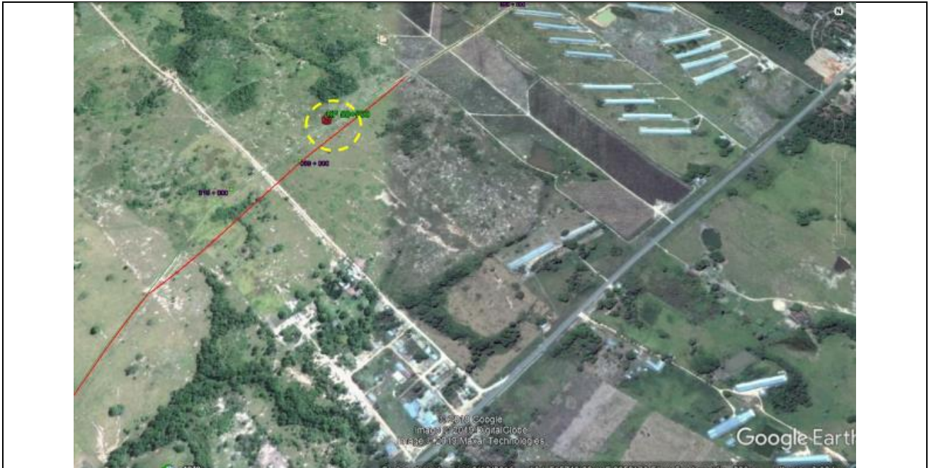
Figura 02: Mapa de ubicación de la zona donde ocurrió la fuga del 25 de junio en el ducto de transporte de LGN.