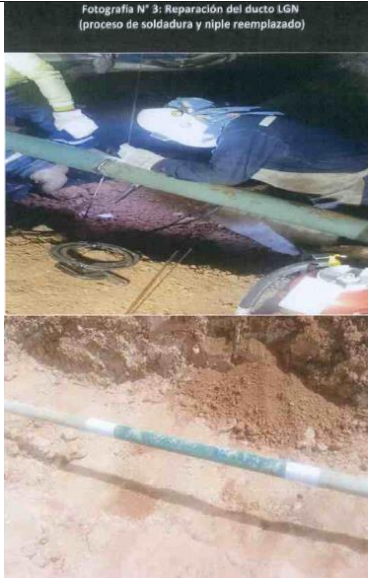
Figura 05: Vista de los trabajos de soldadura del niple de 1.5m reemplazado, a la altura del KP 58+500 Tramo Neshuya – Planta Fraccionamiento