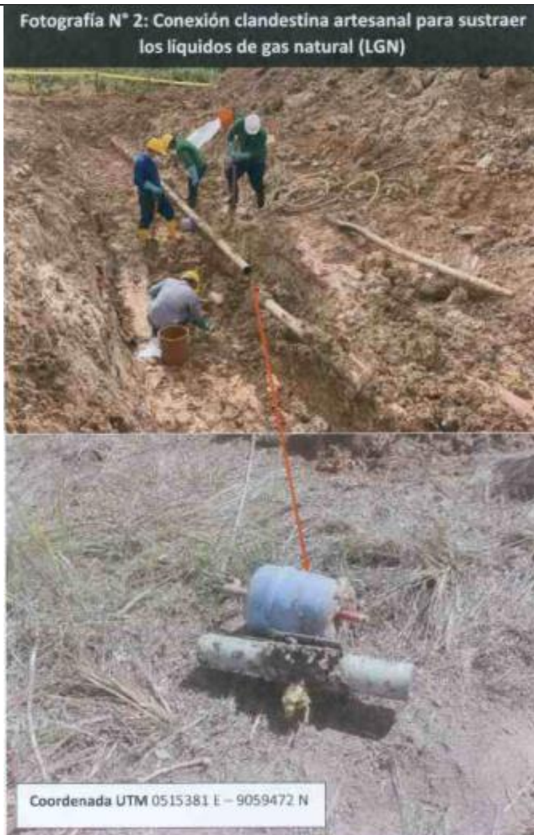
Figura 04: Vista del retiro de la instalación clandestina para sustraer LGN a la altura del KP 58+500 Tramo Neshuya – Planta Fraccionamiento