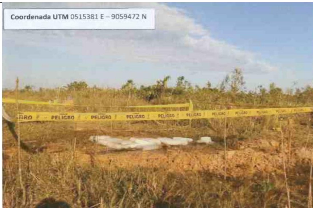
Figura 03: Vista de la zona de falla (KP 58+500 del ducto de 4" de GN del tramo Estación Neshuya - Planta de Fraccionamiento.