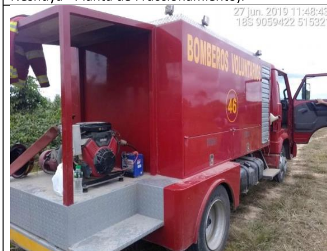
Figura 09: Vista de la unidad de bomberos de Campoverde para acudir ante cualquier emergencia por ignición en el área del derrame.