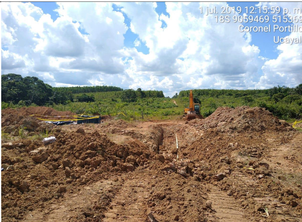
Figura 17: Vista de la actividad de recuperación de tapada, finalizado las actividades de reparación del tramo afectado.