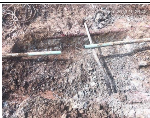
Figura 10: Vista de la sección cortada del ducto de LGN donde se encontraba la grampa artesanal para el robo del combustible.