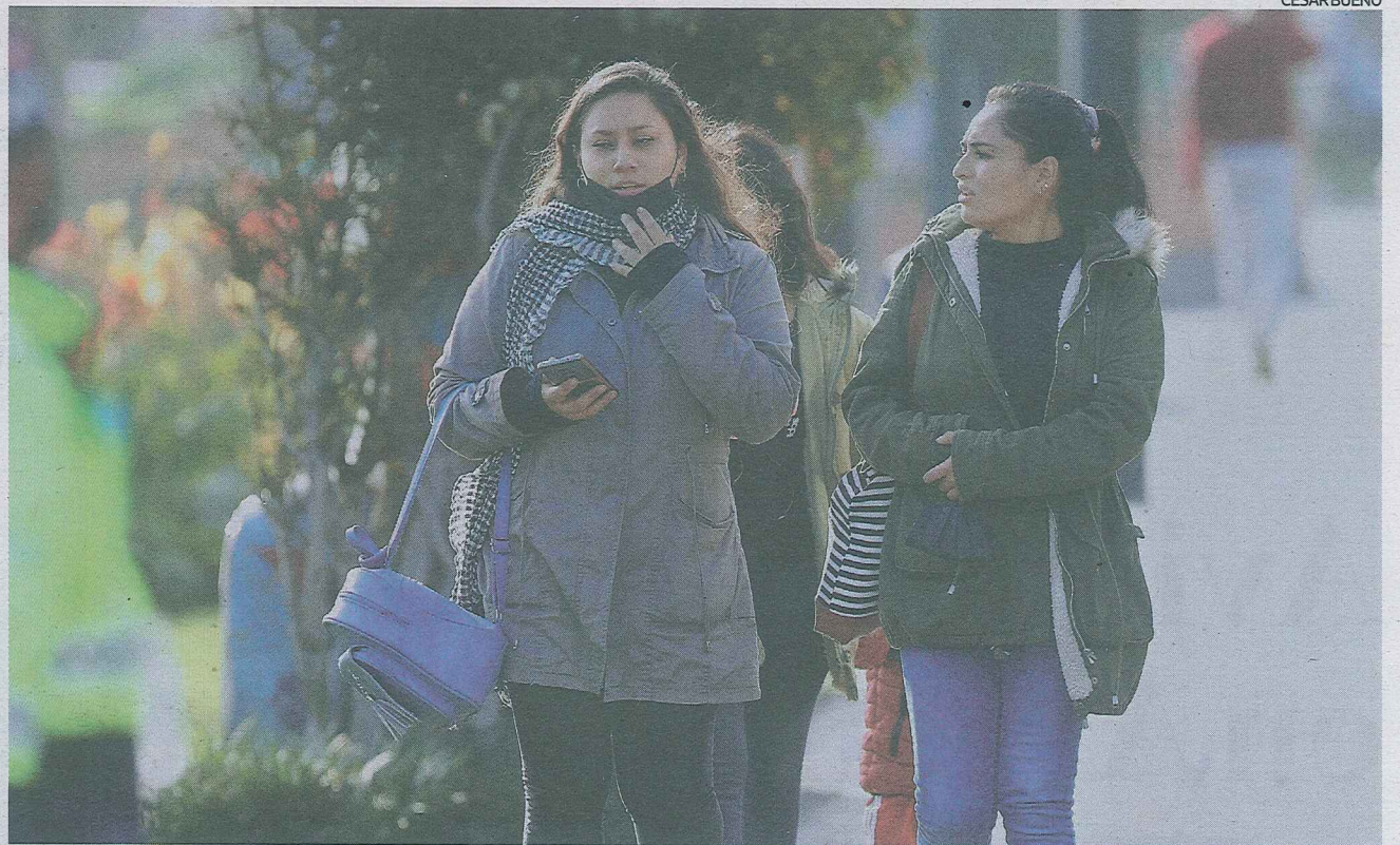
Ayer se registró en la capital una temperatura mínima de 8,4°C. Estas bruscas caídas están asociadas a La Niña, el viento y el cielo despejado.

Ayer se reportó la madrugada más fría en Lima de los últimos 25 años. En la región Puno, la temperatura cayó a -21°C.