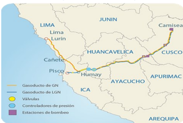
Red de Transporte de Gas Natural de Lima y Callao

EMPRESA TITULAR: TRANSPORTADORA DE GAS DEL PERÚ S.A.-TGP