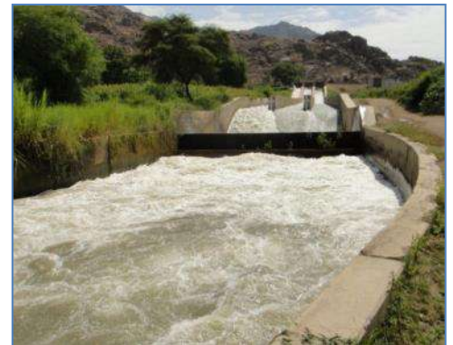
Rápida en el Canal Taymi