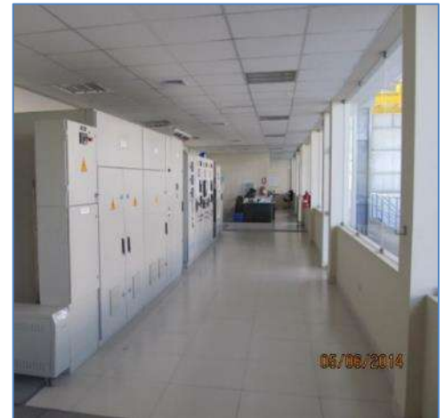
Sala de Control