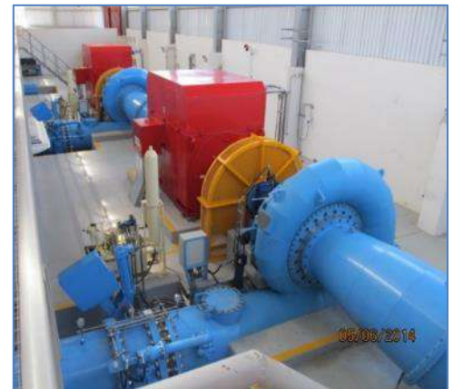
Unidades de Generación