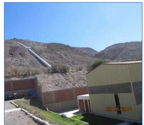
Casa de Máquinas