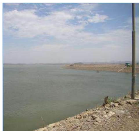
Nivel de Presa Poechos