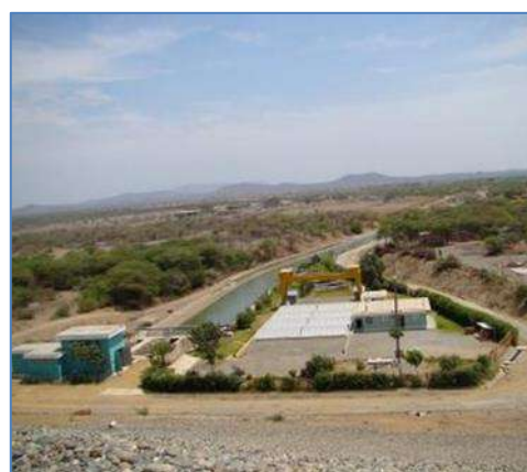
Vista Panorámica de la Central