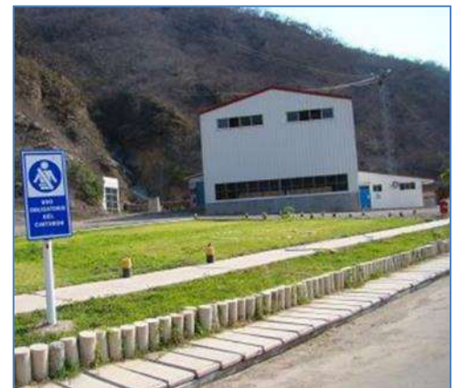
Casa de Máquinas