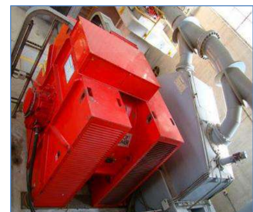
Generador de la Central