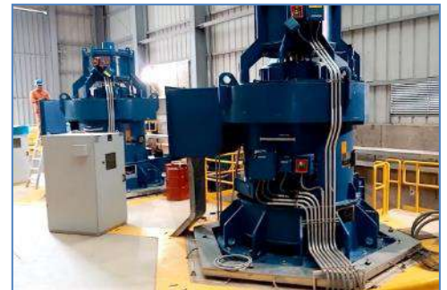
Turbinas y generadores