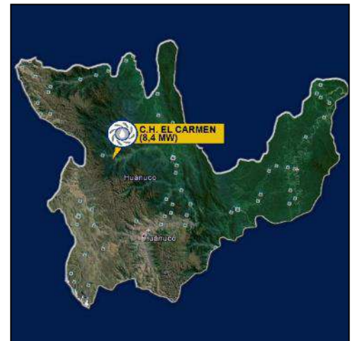
Ubicación de la Central