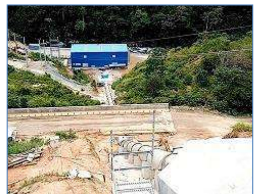
Vista Tubería Forzada y Casa de Máquinas