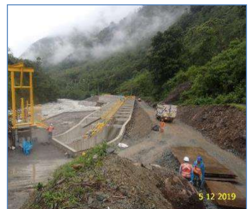
Desarenador de 2 naves