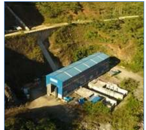
Vista de Tubería Forzada y Casa de Máquinas