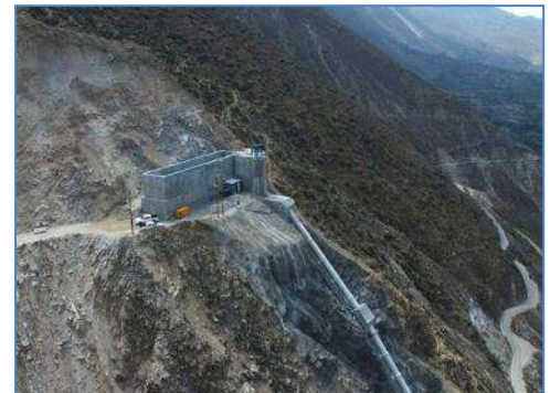
Cámara de carga construida