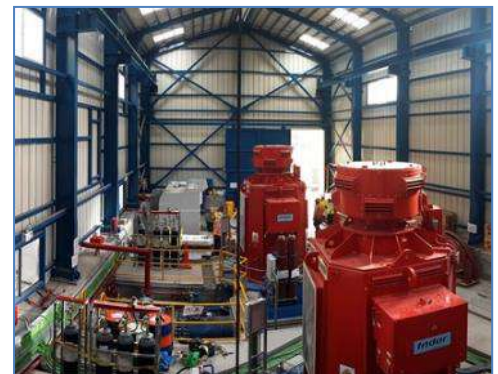
Grupos de Generación