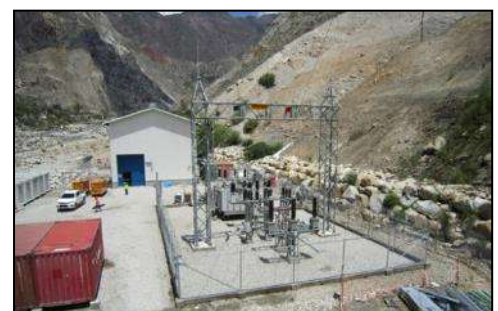
Subestación Eléctrica Manta