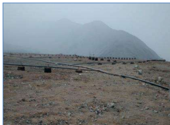
Pozos de extracción de gas