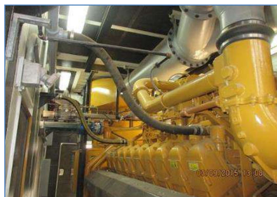
Grupo de Generación N° 2