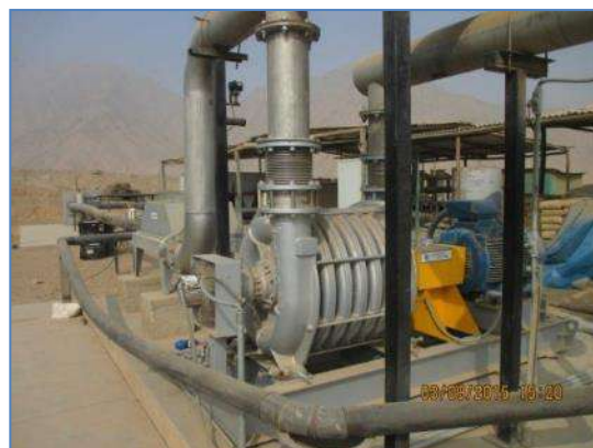
Planta de tratamiento de biogás