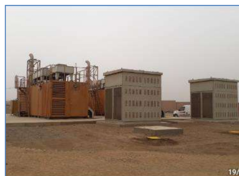
Unidades de Generación y Transformadores