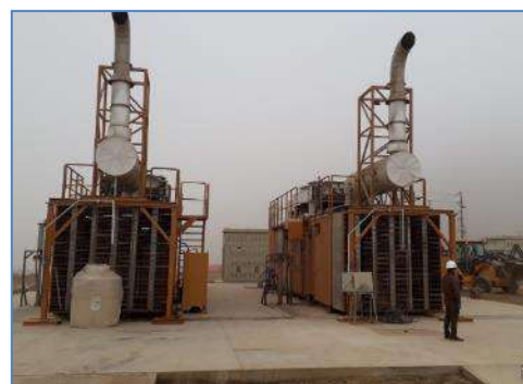
Unidades de Generación C.T.B. Huaycoloro II