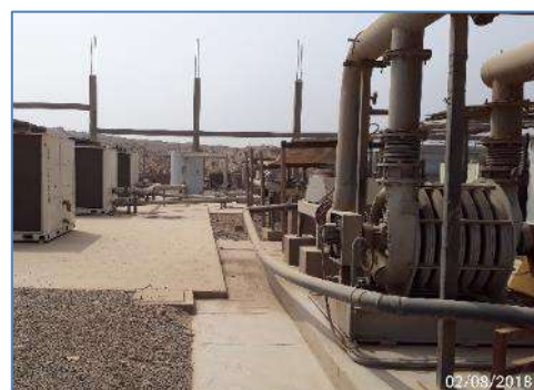
Ampliación de la Estación de Compresión