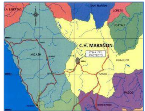
Mapa de ubicación