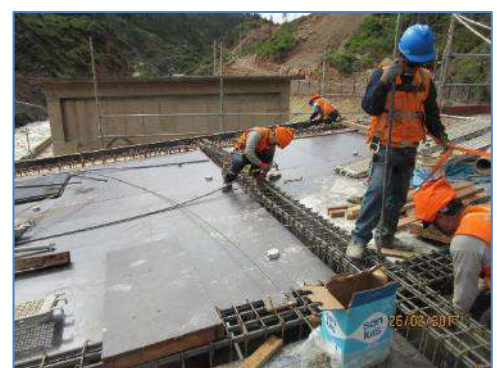
Techo S.E. Marañón