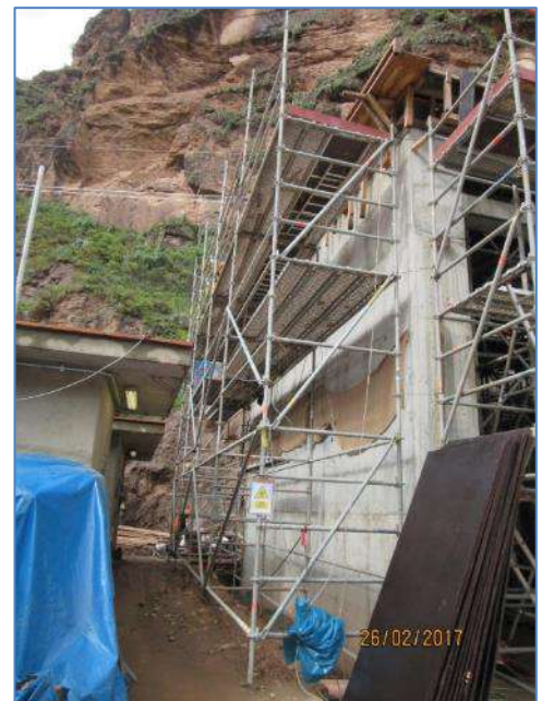
Vista lateral S.E. Marañón