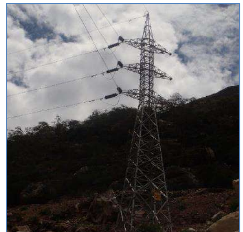
Torre de la Línea de Transmisión