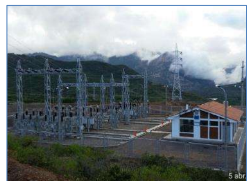
Subestación. Aguas Calientes