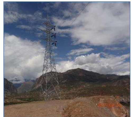
Torre de la Línea de Transmisión