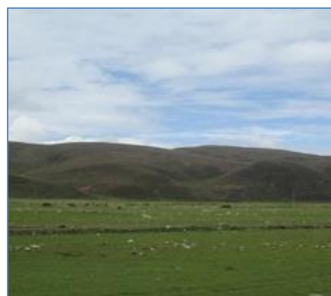
Zona del Canal de Conducción de Bocatoma