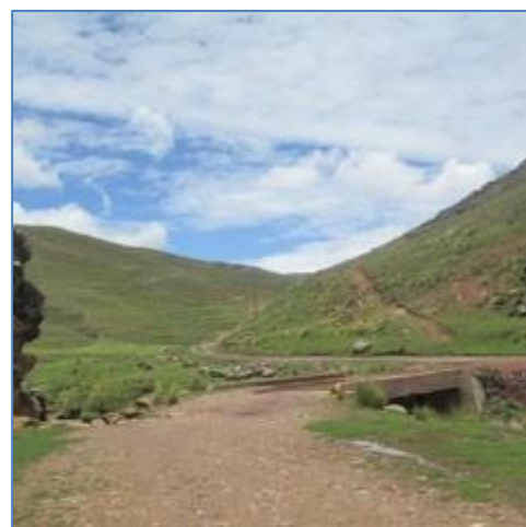
Zona de Presa, río Acco Acco