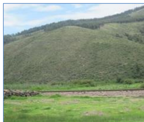
Zona de Descarga al Río Vilcanota