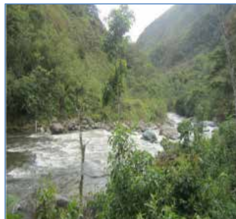
Vista del río El Carmen