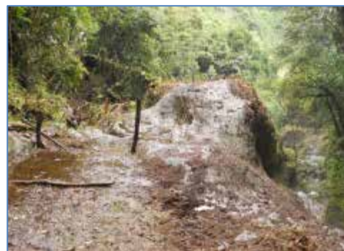
Zona donde se construirá la Casa de Máquinas