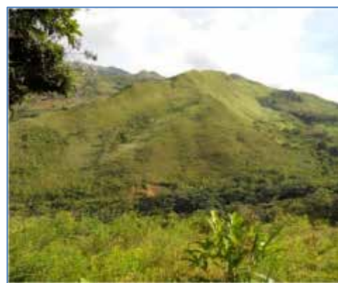
Zona del proyecto