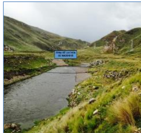
Ubicación de Casa de Máquinas