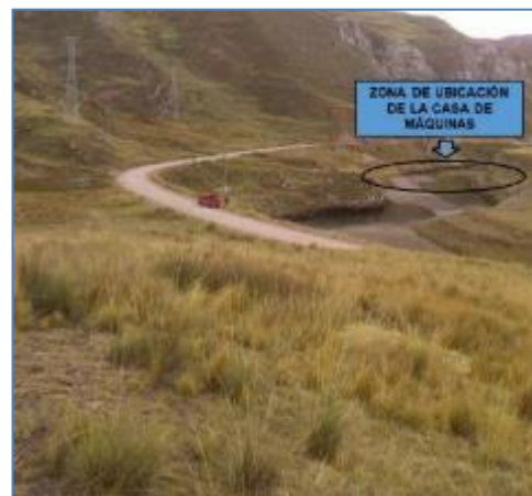
Ubicación de Casa de Máquinas