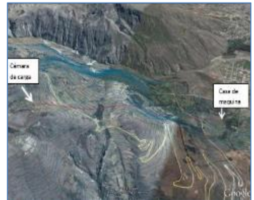
Ubicación del recorrido de la tubería forzada