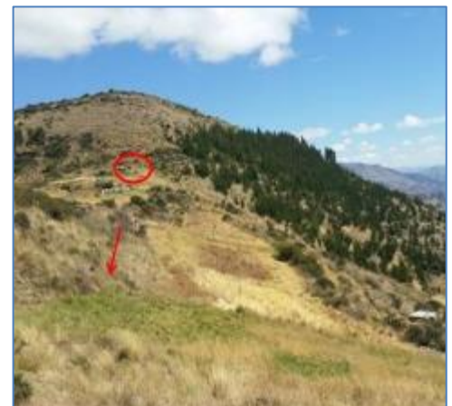
Ubicación de cámara de carga del proyecto