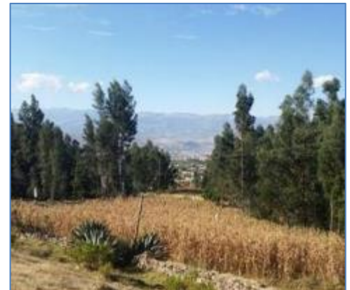
Área de ubicación de la Casa de Máquinas