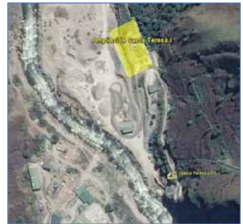
Ubicación de la Subestación de salida