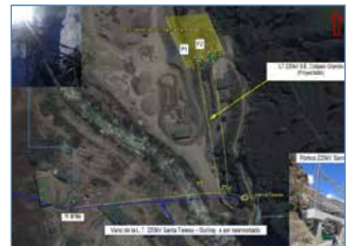
Trazo proyectado de la línea de interconexión

INFORMACIÓN RELEVANTE § Mediante R.M. N° 045-2018-MEM/DM, del 01.02.2018, el MINEM aprobó la modificación de la concesión definitiva para desarrollar la actividad de Ampliación de generación de energía eléctrica (40 MW), en la C.H. Santa Teresa. § El cronograma indica que el Financiamiento de la obra se efectuará al término del segundo año (01.02.2020) y el inicio de obras está previsto para el cuarto año (01.02.2022). § La Concesionaria no ha acreditado el cumplimiento del Hito Cierre Financiero, que según el Cronograma estaba previsto para el 01.02.2020. Con lo cual se está incumpliendo el Cronograma aprobado en el Contrato. § Con Oficio N° 1300-2020-OS-DSE del 10.06.2020, Osinerghmin reiteró a la Concesionaria, la solicitud de información sobre el cumplimiento del Hito Cierre Financiero. § Según Carta N° 109-2020-GD del 13.07.2020, la Concesionaria respondió que se han suscitado factores no atribuibles a INLAND ENERGY S.A.C., como: La negativa del Ministerio de Cultura de otorgar el CIRA; El Incremento de los riesgos sectoriales, a los que se encuentran expuestos los titulares de la actividad eléctrica hechos que han impedido concretar el Cierre Financiero. § Con Oficio N° 3001-2020-OS-DSE del 11.12.2020, Osinerghmin informó al MINEM sobre el incumplimiento del Hito Cierre Financiero por parte de la Concesionaria. § La Carta Fianza de fiel cumplimiento está vigente hasta el 30.11.2021.