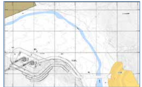
Vista de Planta