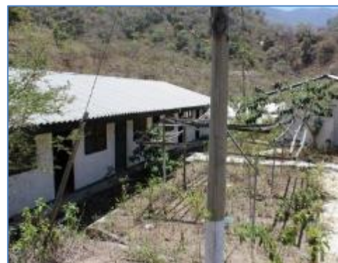
Zona de Campamento – Oficinas administrativas