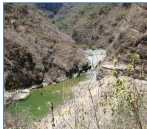
Vista de dique y salida de túnel trasandino