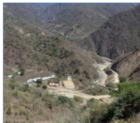
Vista aérea de caminos de acceso hacia Campamentos