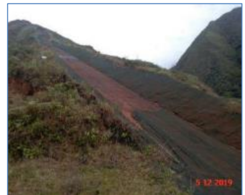
Plataforma de Tubería de Presión