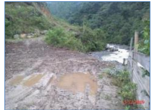
Plataforma para la Casa de Máquinas