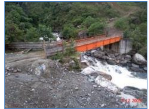
Puente N° 1 – Acceso a Casa de Máquinas