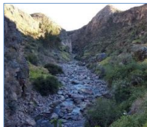
Zona del Canal de Aducción