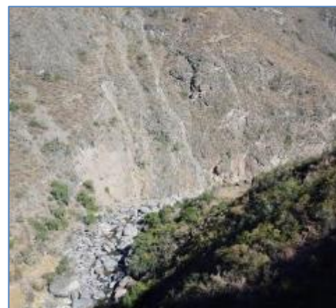
Zona de Casa de Máquinas