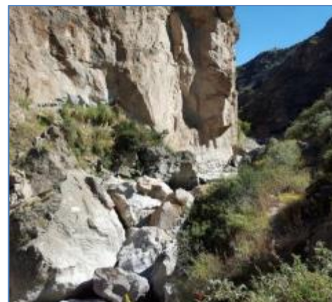
Vista aguas arriba de la Bocanoma