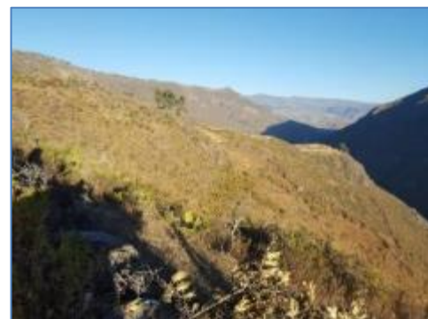
Zona de Tubería Forzada