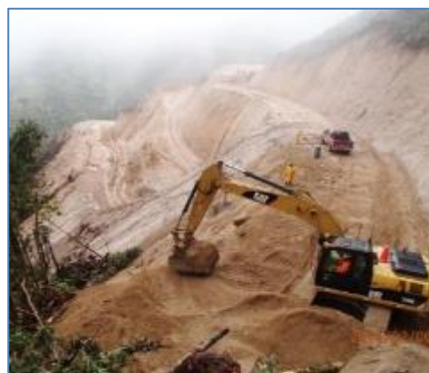
Apertura de trocha de acceso a Casa de Máquinas