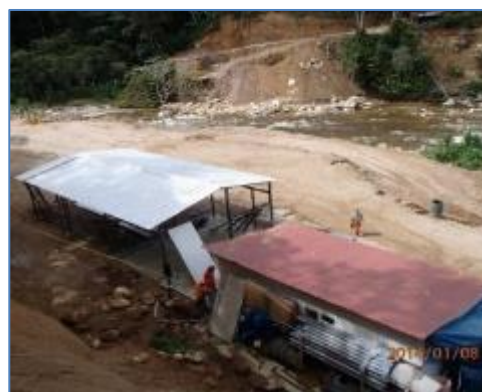
Construcción de campamento provisional