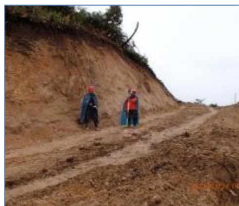
Trazo y replanteo