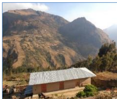
Zona de la Tubería Forzada