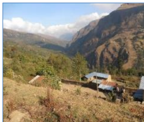
Zona del Canal de Aducción