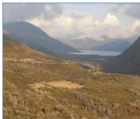
Bocatoma – laguna Carpa