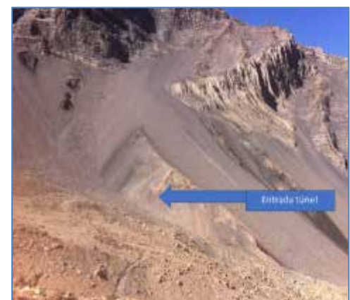
Entrada al Túnel de Conducción