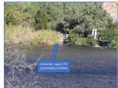
Nueva ubicación de la captación