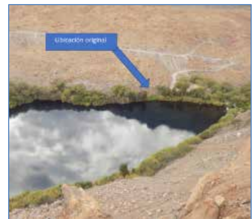
Ubicación original de la captación