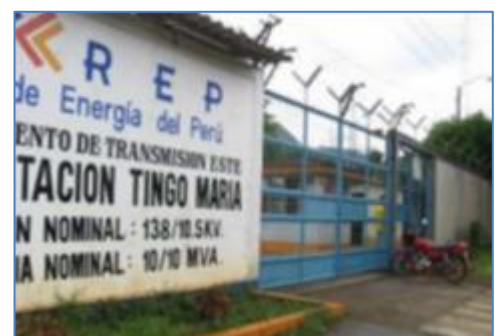
Llegada a S.E. Tingo María