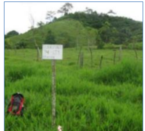
Terreno de ubicación de la S.E. Belo Horizonte