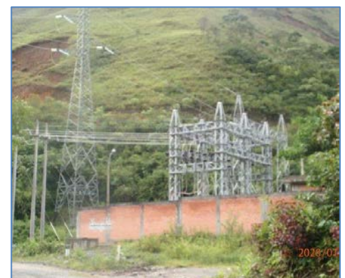
S.E. 8 de Agosto