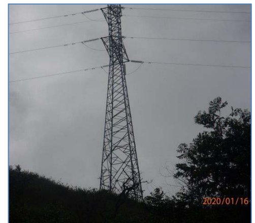
Torre de la L.T. 138 kV 8 de Agosto – Tingo María