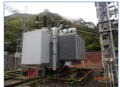
Transformador de Potencia (13,8/22,9/138 kV)