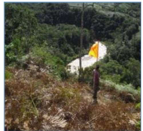
Trabajos de replanteo de la L.T. (Vértice V1)