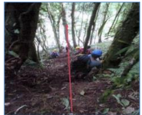
Obras preliminares: estudios de suelos