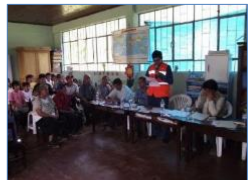
Taller participativo EIA L.T. 60 kV